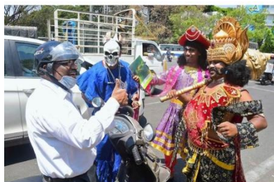
Instant feedback Artists of Shishu Mandira staging a street play to create awareness against tobacco usage, in front of Town Hall in Bengaluru on Wednesday. SUDHAKARA JAIN SUDHAKARA JAIN

Die drittgrößte englischsprachige Zeitung Indiens berichtete in ihrer Online-Ausgabe über Shishu Mandirs Straßentheater-Gruppe, die die Passanten über die Gefahren des Rauchens aufzuklären versuchte.